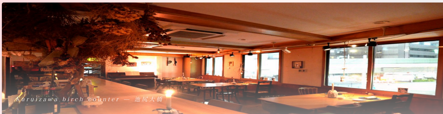
Karuizawa birch counter — 池尻大橋